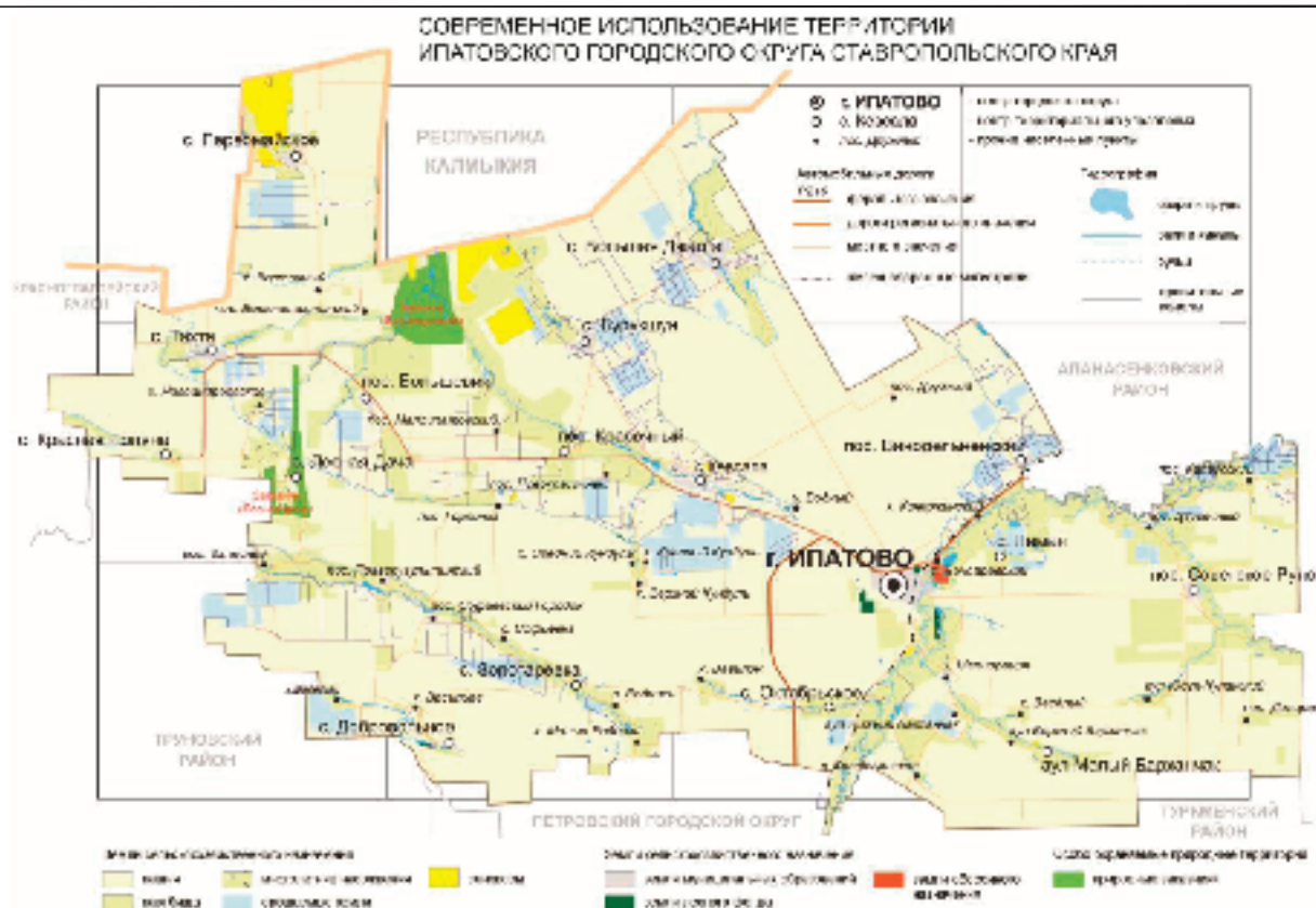
Рисунок 35 – Современное использование территории Ипатовского городского округа

Ипатовский городской округ имеет повышенный потенциал земель сельскохозяйственного назначения, – их доля в общей площади земель составляет 96,3%, при значении этого параметра в среднем по Ставропольскому краю – 92,2%.